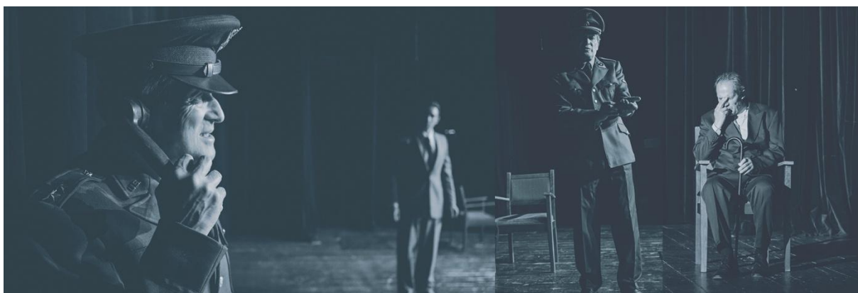
Blizny pamięci..., zdjęcie z próby, Warszawa 2016 r.

Wpisuję do pamięci każde przekazane zdanie. Mam je wiernie powtórzyć bez pomyłek w słowach czy intencjach. Nie mogę niczego spisać, to moja tajna amunicja – ładuję ją do magazynków pamięci, jak naboje do pistoletu i choć nie wystrzelą są śmiertelnie niebezpieczne dla wroga. I dla mnie.